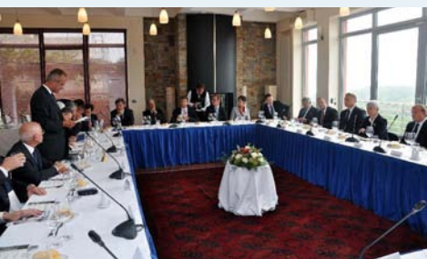
→ EU veleposlanici i premijerka Kosor