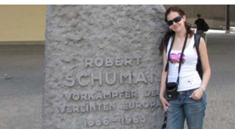
→ Ema pred zgradom Europske komisije