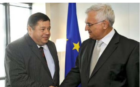
→ Ministar Čobanković i povjerenik Dali

Više informacija na stranicama Delegacije .