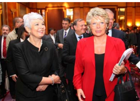
→ Premijerka Kosor i potpredsjednica Reding