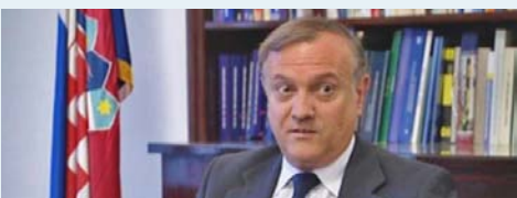
→ Ministar Bošnjaković

Više informacija na stranicama Delegacije .