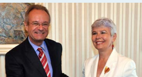
→ Veleposlanik Vandoren i premijerka Kosor

Više informacija na stranicama Delegacije .