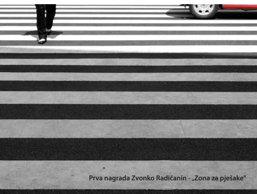
Prva nagrada Zvonko Radičanin - „Zona za pješake“