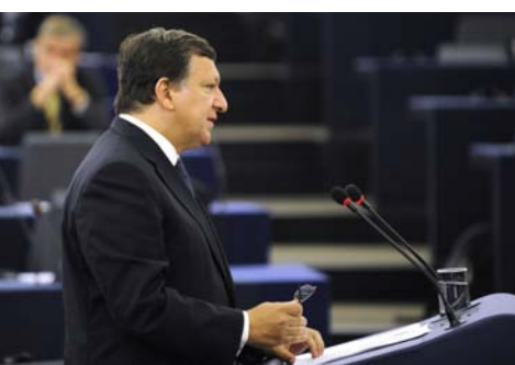
→ Predsjednik Barroso u Europskom parlamentu